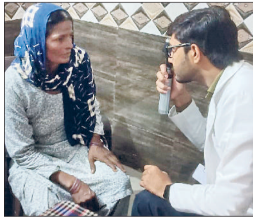
खरखोदा। आंखों की जांच करते हुए नेत्र चिकित्सक।