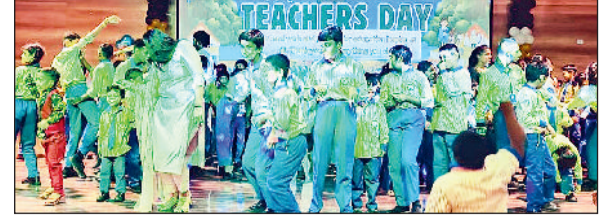
राई। रेणु विद्या मंदिर के छात्र सांस्कृतिक कार्यक्रम प्रस्तुत करते हुए।