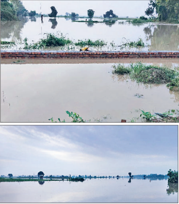
सोनीपत। जगदीशपुर गांव में पहुंचा यमुना का पानी व बाढ़ पीड़ितों को भोजन देते।

बर्बाद या बुरी तरह प्रभावित हुई है। विशेष रूप से सब्जियों की फसल पूरी तरह नष्ट हो चुकी है, जिससे किसानों को भारी आर्थिक नुकसान उठाना पड़ रहा है। खेतों की उपजाऊ मिट्टी के बह जाने से