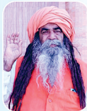
With the blessings of Baba Bhole Daas ji