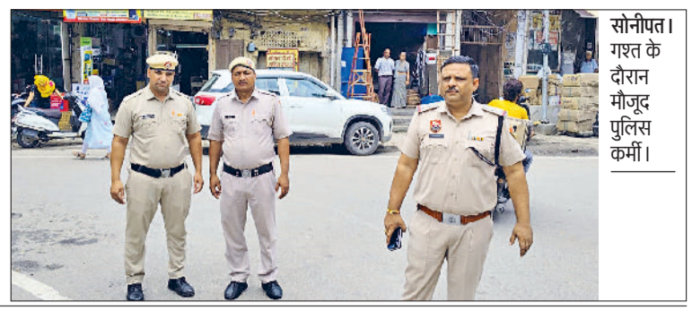
सोनीपत। गश्त के दौरान मौजूद पुलिस कर्मी।